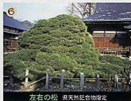
左右の松 県天然記念物指定

石の鳥居の南側に位置する、父母報恩寺の境内にあるソメイヨシノ、八重桜が四月になると鮮やかに咲きほころぶ。