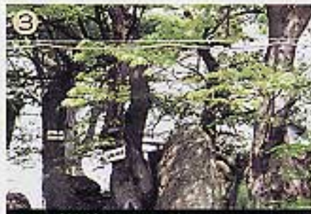
あたご神社のけやき林 県天然記念物指定

橋岡小学校舎の北側の橋山にブナの木があり、樹齢およそ100年・標高100mのような標高地にあるのは、さわめてまれである。