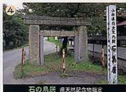
石の鳥居 県天然記念物指定

凝灰岩のあいだを縫うように根が張る。橋岡商店街を北進すると、道路両側に巨岩を見ることができる。世にいう「切通し」の左側の小高い岩石のうえにあたご神社がある。